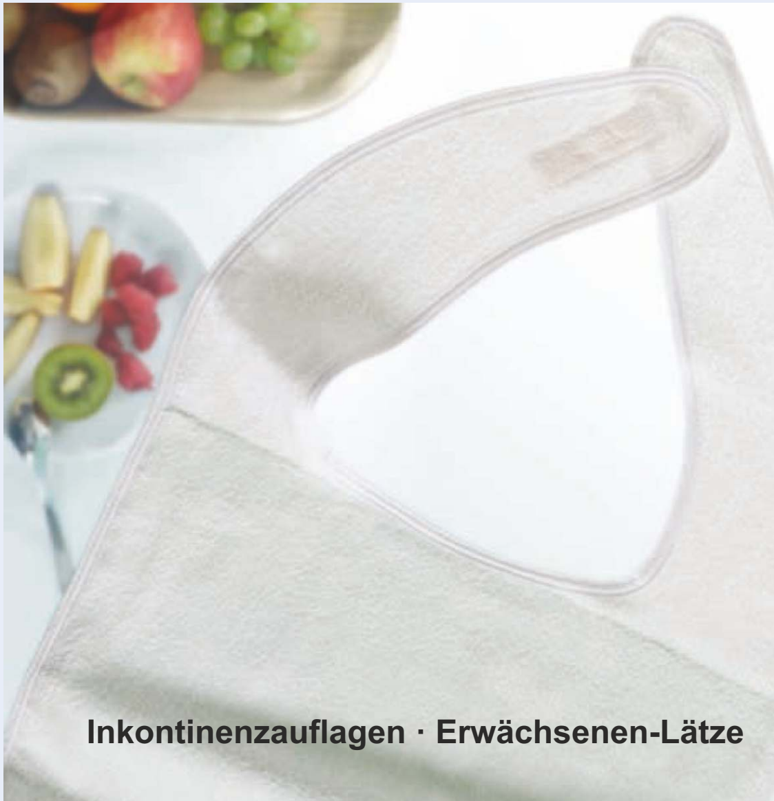
Inkontinenzauflagen · Erwachsenen-Lätzchen