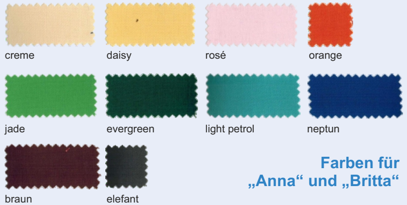
Farben für „Anna“ und „Britta“

Diese Maske können wir mit Ihrem Logo als Stickerei oder Transferdruck veredeln. Bitte fragen Sie Ihr individuelles Angebot an.